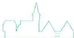
Torsten Hooge Bürgermeister